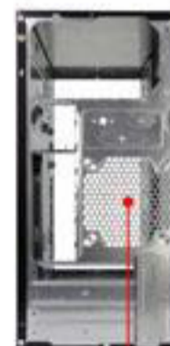
Ventilador Posterior (Opcional) 80 x 80 mm x 1 o 90 x 90 mm x 1